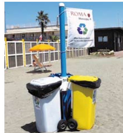
Mini Isola Ecologica con 3 contenitori da 120 litri. Altezza Palo 2 mt. fuori terra.