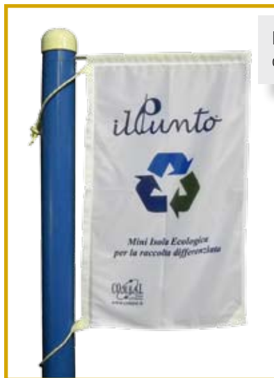
Bandiera verticale in tessuto con stampa, di diverse misure, completa di cime per fissarla al palo.