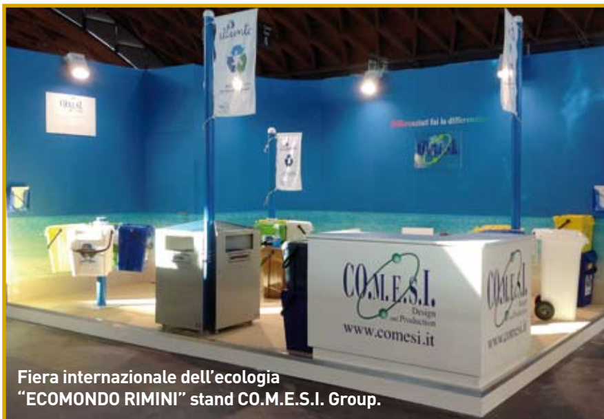
Fiera internazionale dell'ecologia "ECOMONDO RIMINI" stand CO.M.E.S.I. Group.