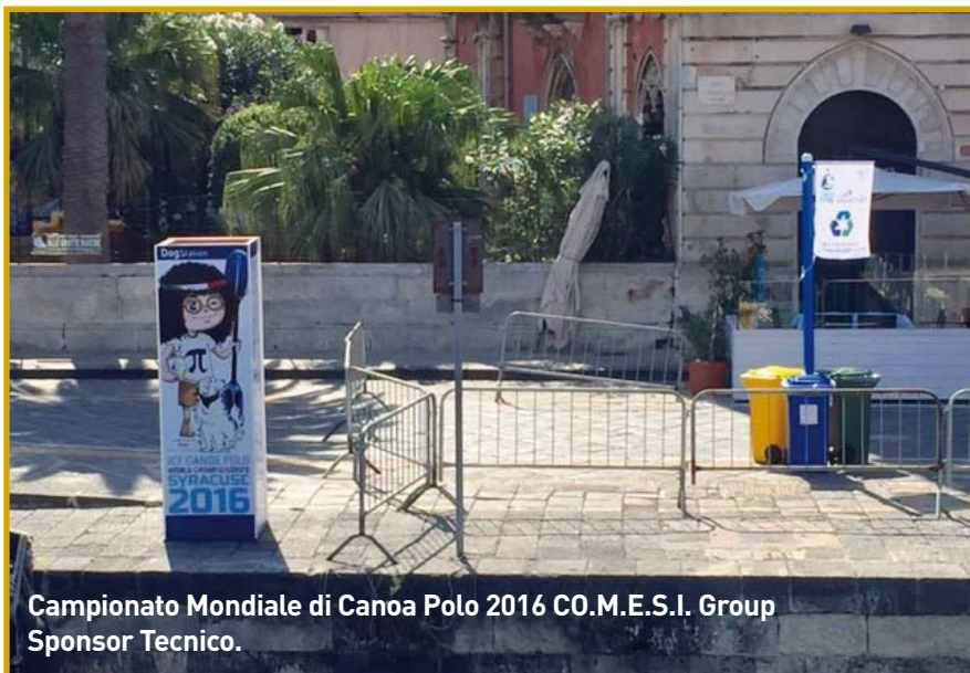
Campionato Mondiale di Canoa Polo 2016 CO.M.E.S.I. Group Sponsor Tecnico.