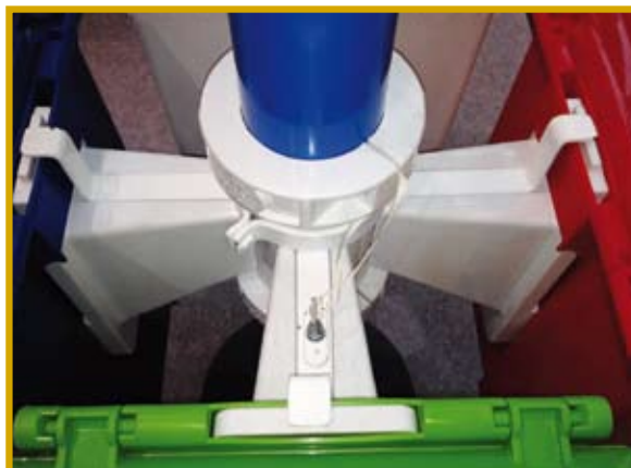
Blocco per contenitori con serratura a chiave, in acciaio verniciato.