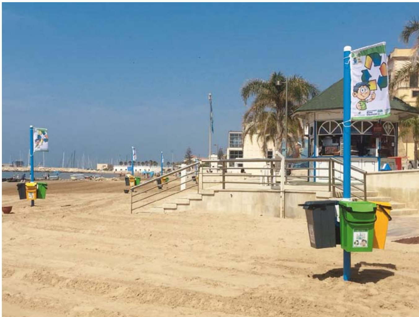
Mini Isola Ecologica con 4 contenitori da 60 litri - Altezza Palo 3 mt. fuori terra.