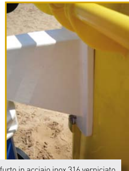
Blocco antifurto in acciaio inox 316 verniciato per contenitori da 120 lt. completo di lucchetto.