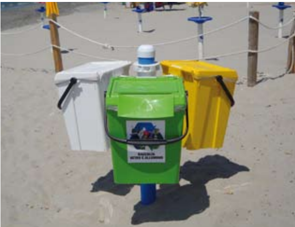
Mini Isola Ecologica con 3 contenitori da 50 litri. Altezza Palo 1 mt. fuori terra.