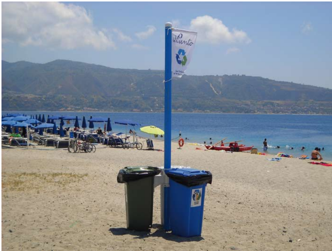
Mini Isola Ecologica con 3 contenitori da 120 litri. Altezza Palo 3 mt. fuori terra.