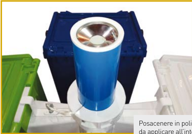
Posacenere in polietilene stampato, da applicare all'interno del palo.