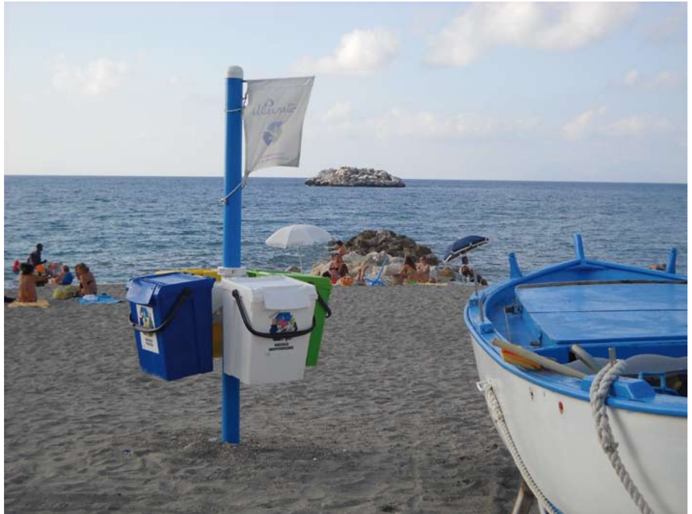
Mini Isola Ecologica con 4 contenitori da 50 litri. Altezza Palo 2 mt. fuori terra.