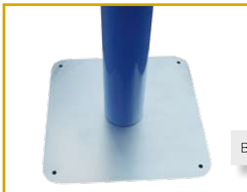
Base in acciaio con 4 fori per il fissaggio a terra.