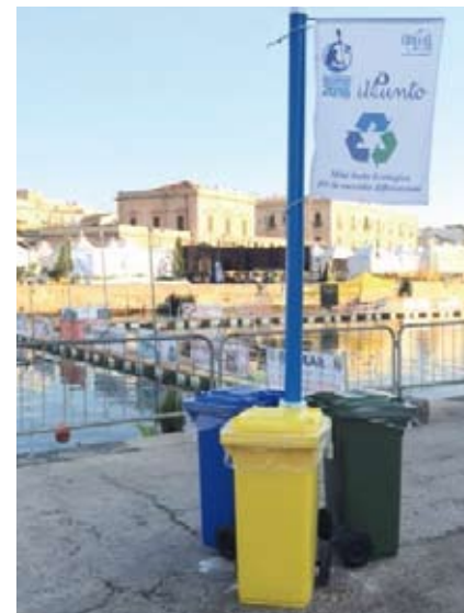
Campionato Mondiale di Canoa Polo 2016, CO.M.E.S.I. Group sponsor tecnico.