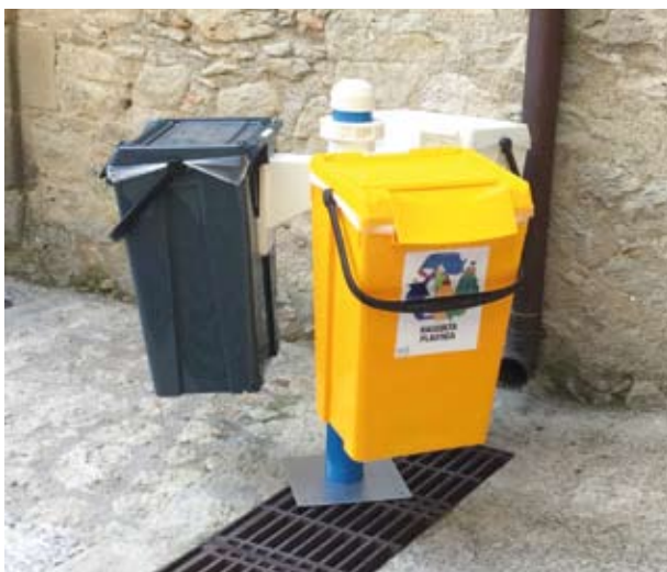
Mini Isola Ecologica con 3 contenitori da 60 litri. Altezza Palo 1 mt.