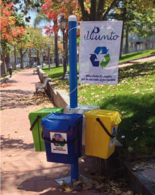
Mini Isola Ecologica con 4 contenitori da 50 litri. Altezza Palo 2,00 mt. con base in acciaio.